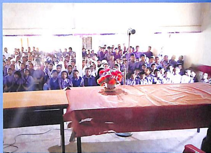
Swachhta Avijan 2018