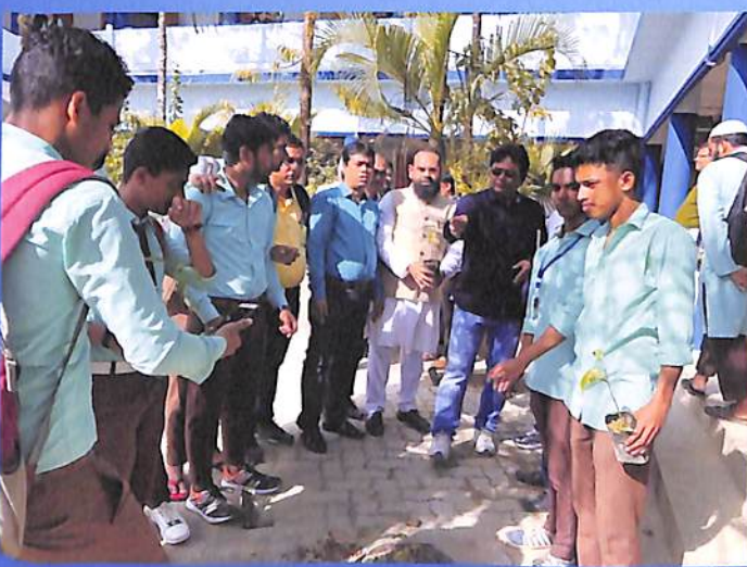
Plantation by Students' Union along with ACTA officials