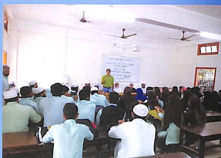
Departmental Seminar of Arabic Odd Sem. 2018