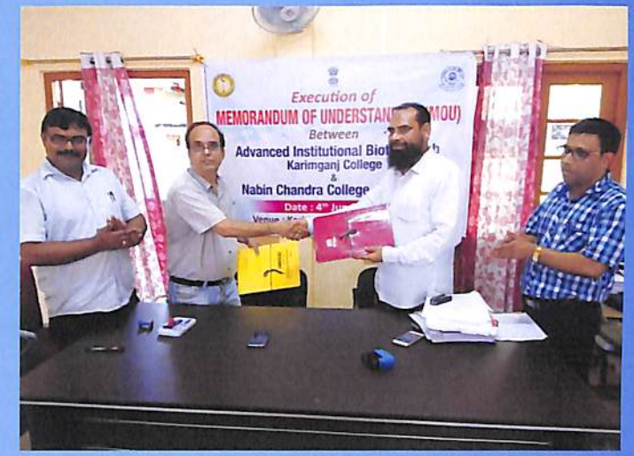
Signing MOU with Karimganj College