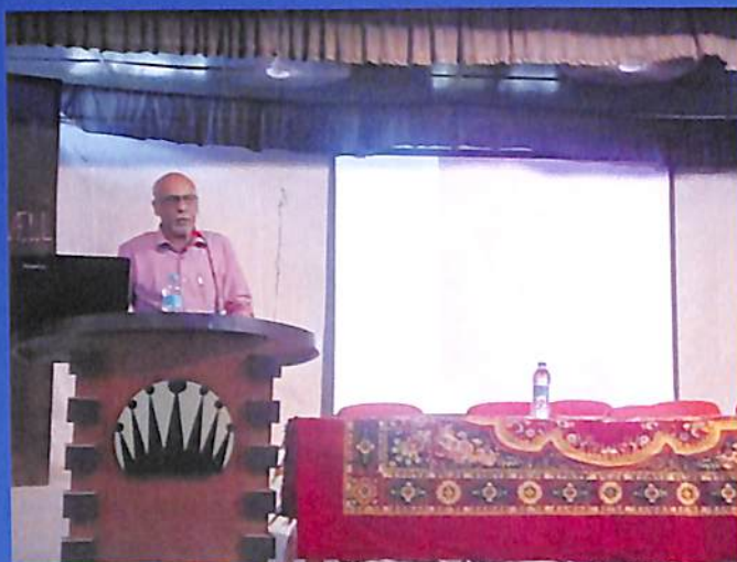
Guest Lecture Department of Commerce Odd Semester 2018