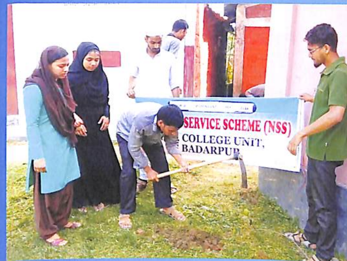
National Service Scheme (NSS) 2018