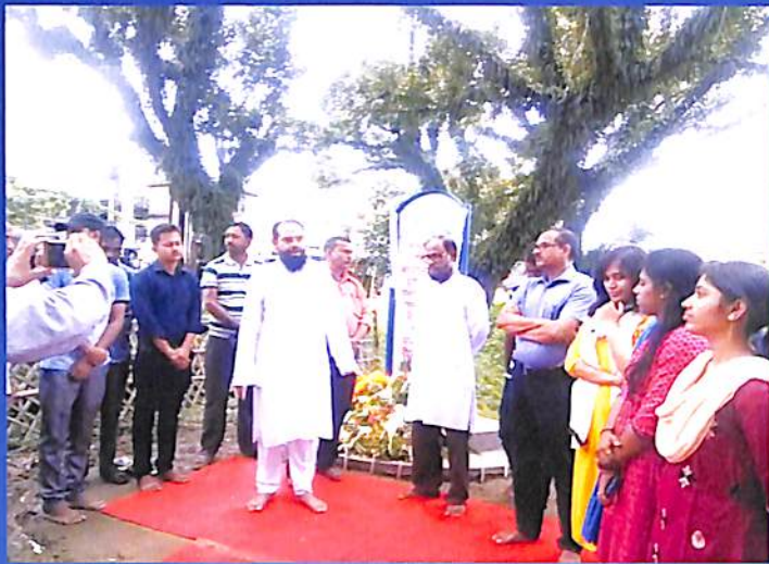
A Click of Bhasha Sahid Divas 2018