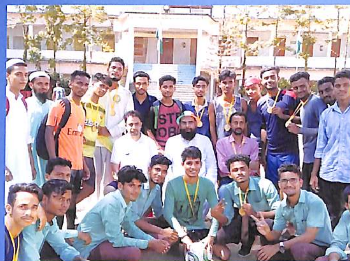
After football match NCC / NSS on 15 August 2018