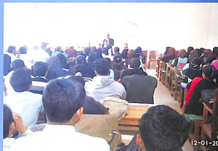
National Youth Day 2018