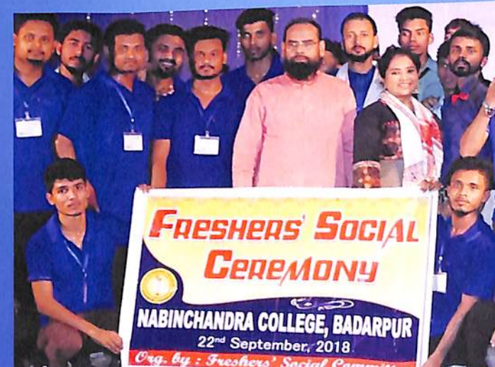
Freshers' Social Seremony 2018