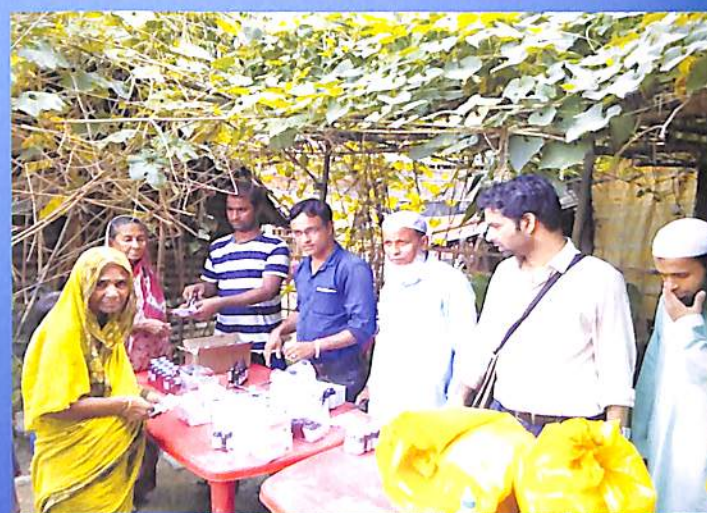
Medical Camp & Free Medicine distribution 2018