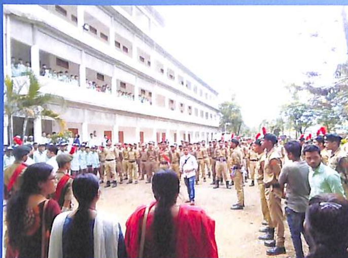
Independence Day Celebration 2018