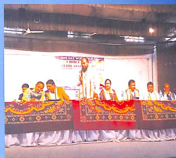
One Day Work Shop on Choice Based Credit System