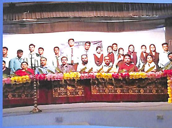
Oath taking programme of Students Union 2018