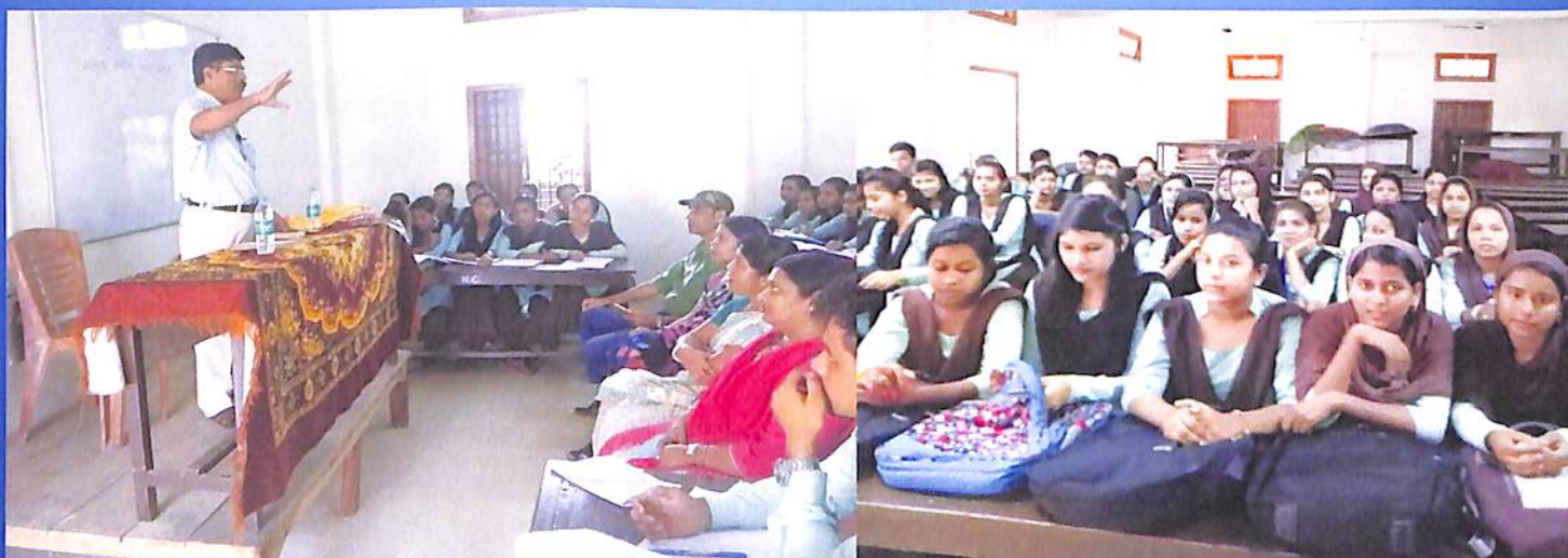
Guest Lecture, Bengali Odd Sem. 2018