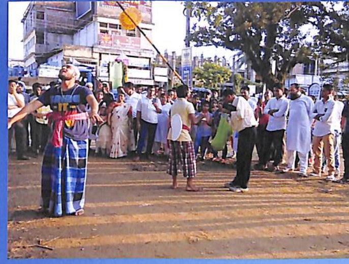
Street play on National Intrigation