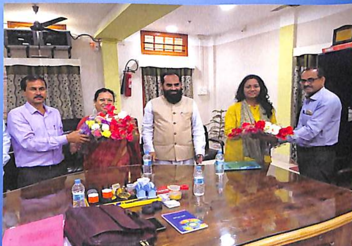
RUSA (ASSAM) team