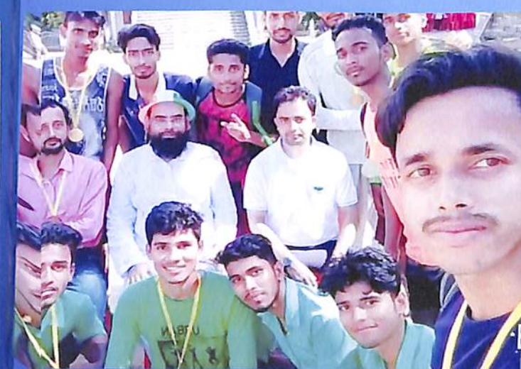
Football Match on independence Day 2018