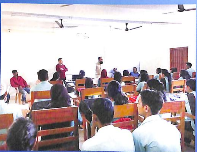
National Voters Day 2018