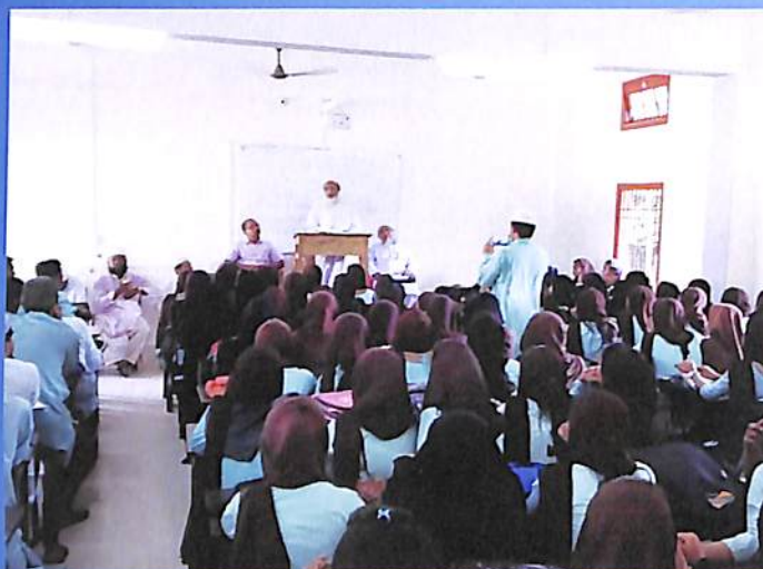
Guest Lecture (Dept. of Arabic) Odd Semester 2018