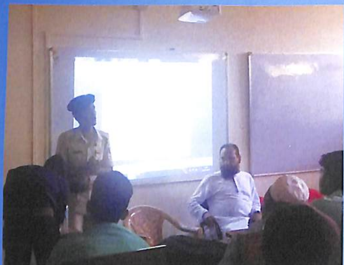
NSS Workshop on First Aid & Disaster Management 2018