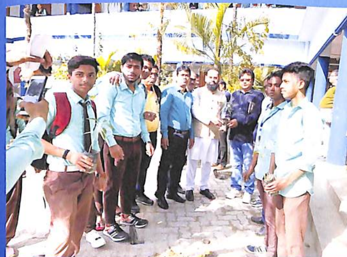
Plantation Programme 2018