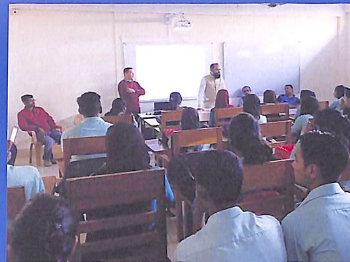
ICT training to Students by N C college ICT Cell