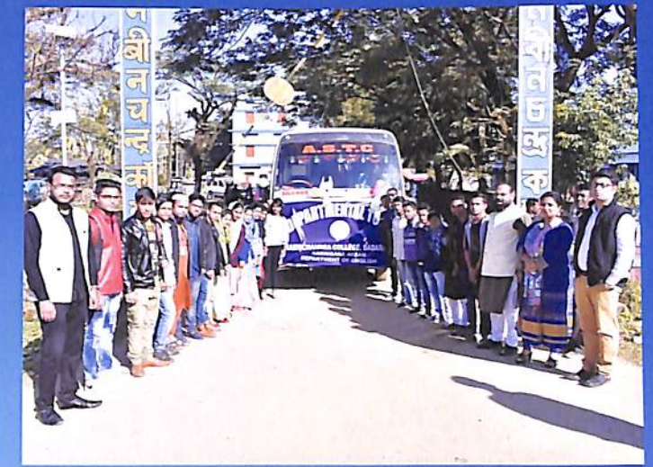
Departmental Tour, Dept. of English Odd Sem. 2018