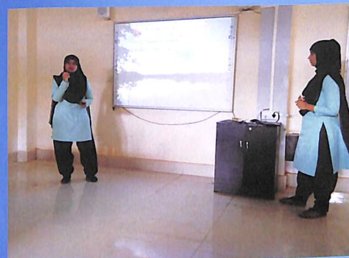
Students presenting papers at Departmental seminar, English Department Odd Sem.2018