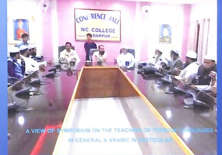
A view of symposium of the teaching of foreign languages in general and Arabic in particular