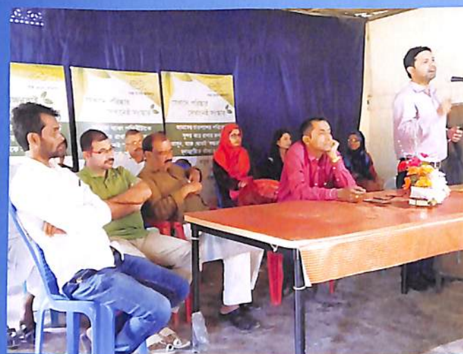
Swachhta Avijan 2018 (NSS)