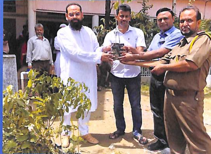
Plantation at N C College