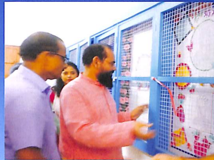
Departmental Wall Magazine (Bengali) Odd Sem. 20108