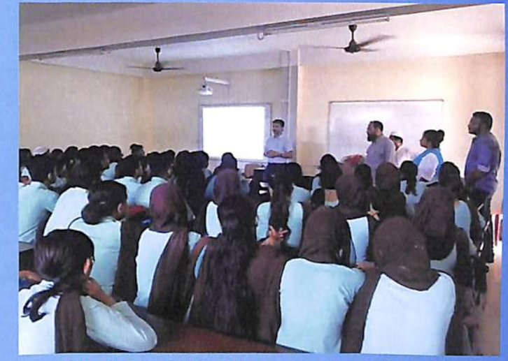
Students attending guest lecture at Department of English Odd Sem 2018