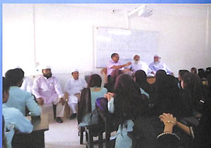
Departmental (Arabic) Guest Lecture 2018