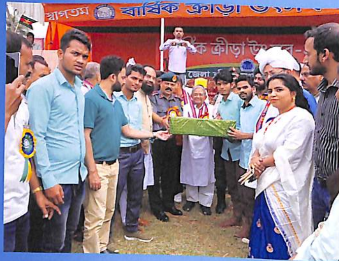
Receiving Award at DSA Karimganj