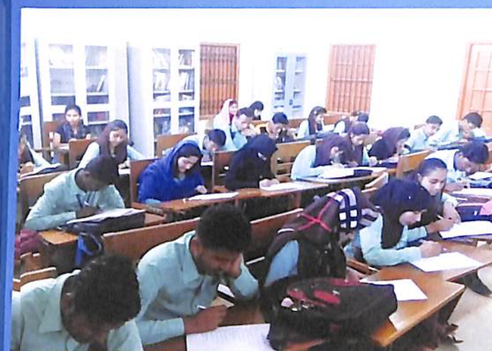
NSS written Quiz competition on Human Rights on the occasion of Human Rights Day 2018