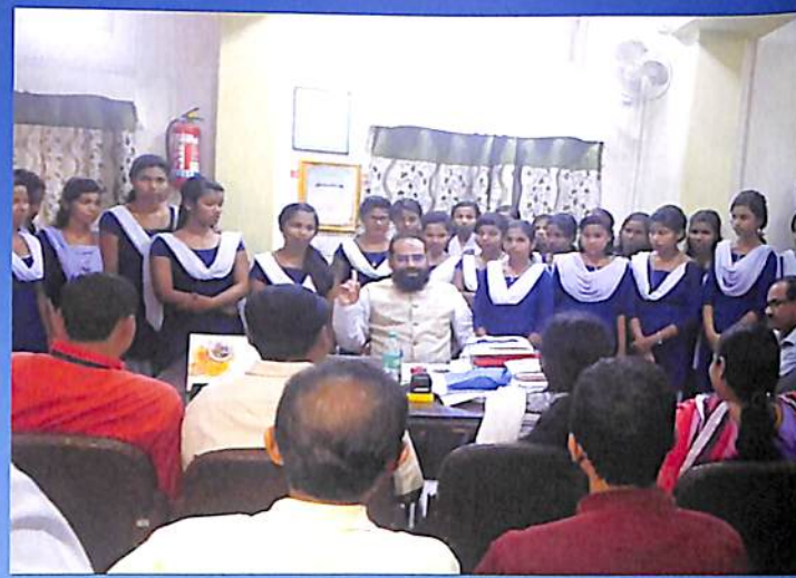
Students of Mahadev H.S. School at N C College visit.