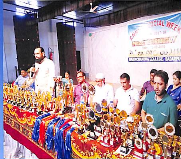
Annual Social Week 2018