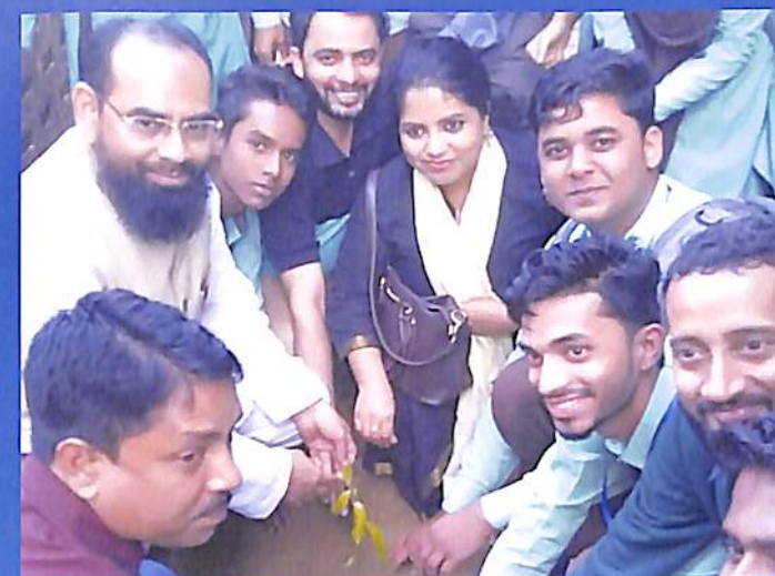
Plantation programme after Students' Union Oath Taking Ceremony