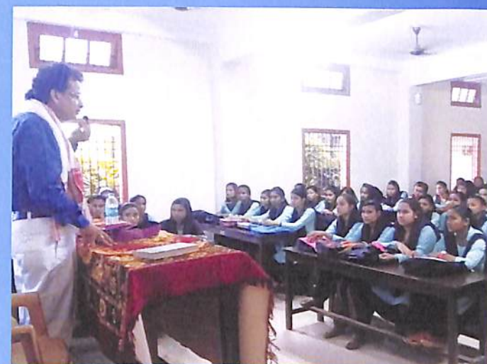
Guest Lecture Dept. of History Odd Sem. 2018