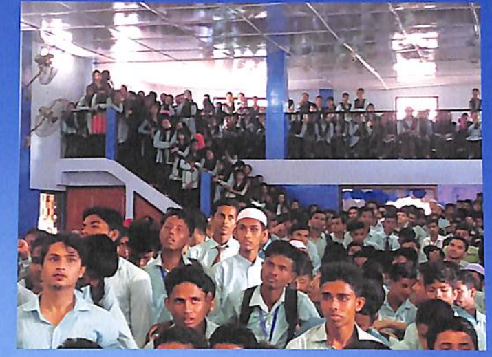
Freshers Social 2018