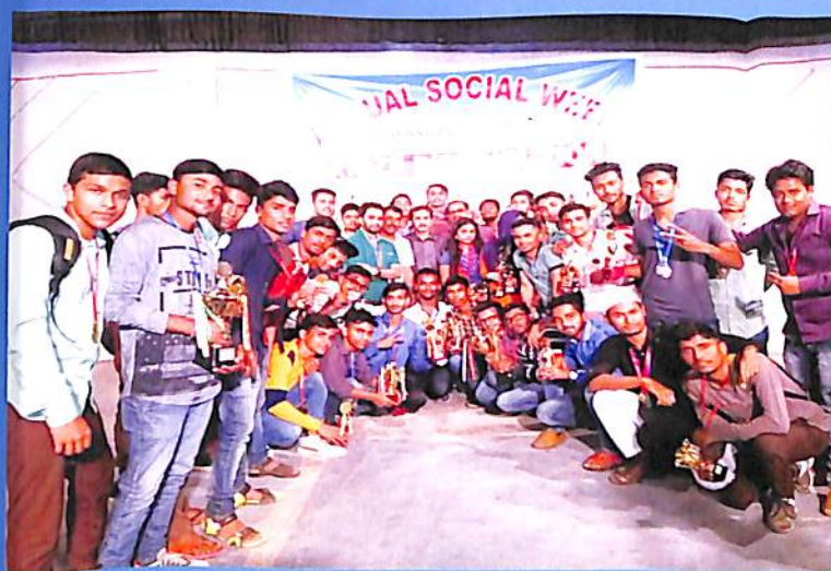
Annual Social Week 2017-18