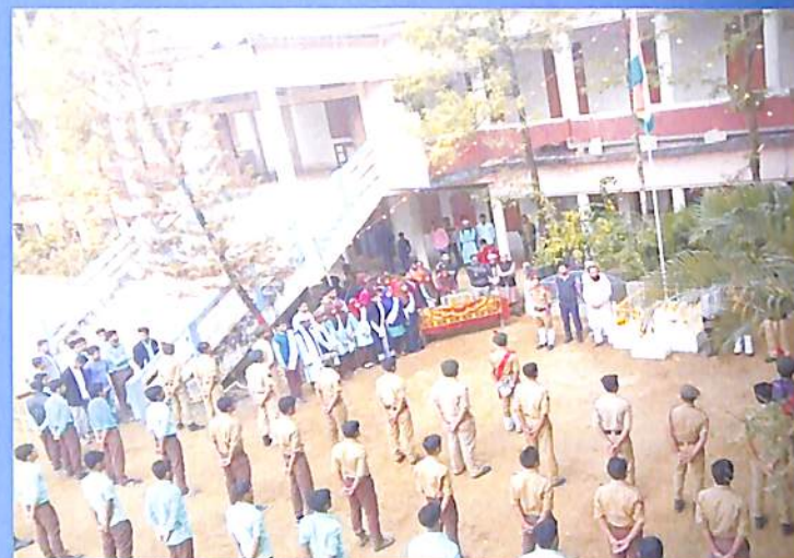
Republic Day Celebration 2018