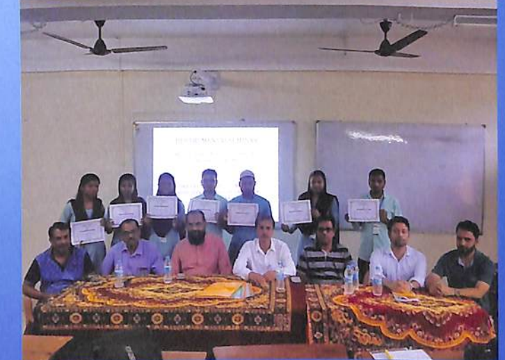
Departmental seminar in the Department of Economics Odd Sem. 2018