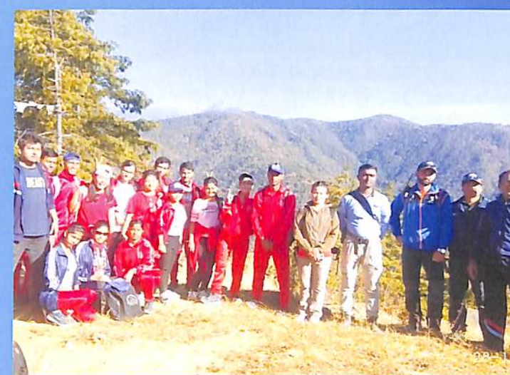
Tracking by NCC Cadets Odd Sem. 2018