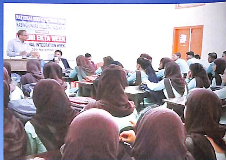
Qaumic Ekta Week 2018