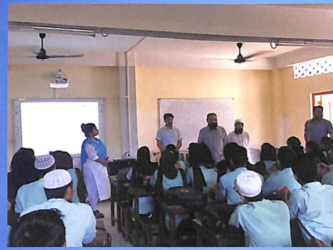
Guest Lecture English Odd Sem. 2018