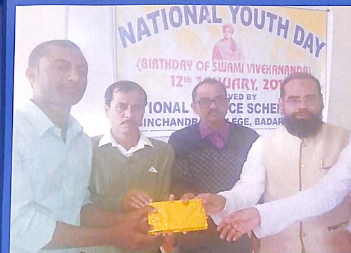
National Youth Day 2018