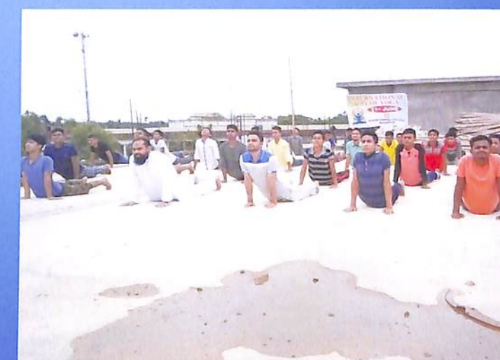
National Yoga Day 2018