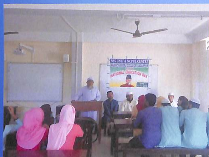
Observation of National Education Day, 2018