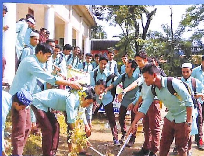
Swachhta Avijan 2018