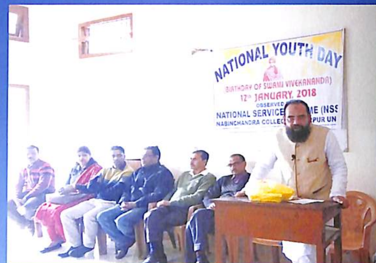
National Youth Day 2018