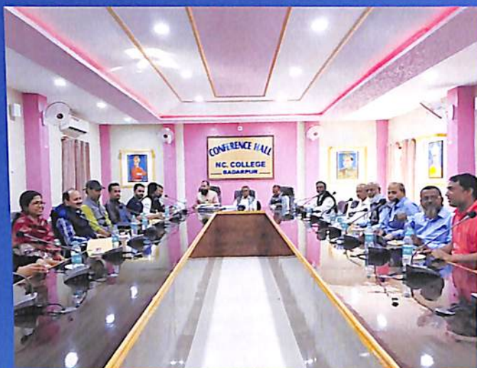
Centre Committee Meeting 2018