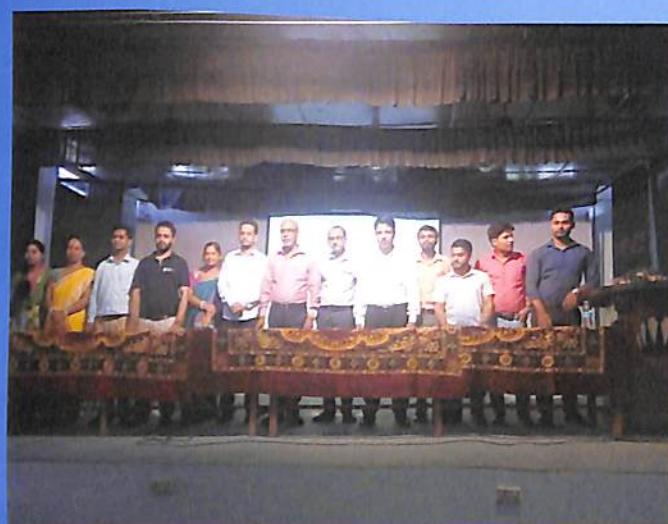
A view of the dept. of commerce along with the guest lecturer