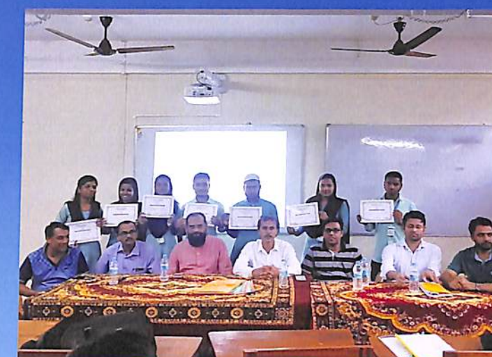
Departmental Seminar (Economics) Odd Sem. 2018