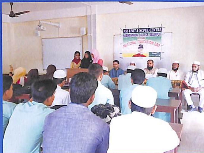
National Education Day 2018