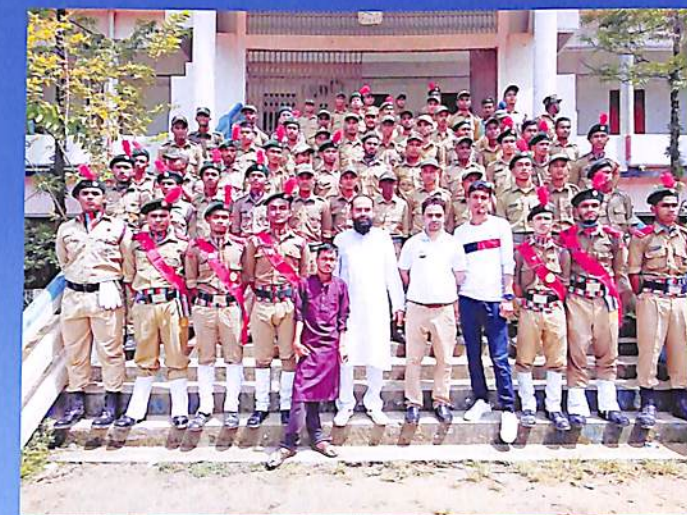
NCC Unit, N C. College 2018