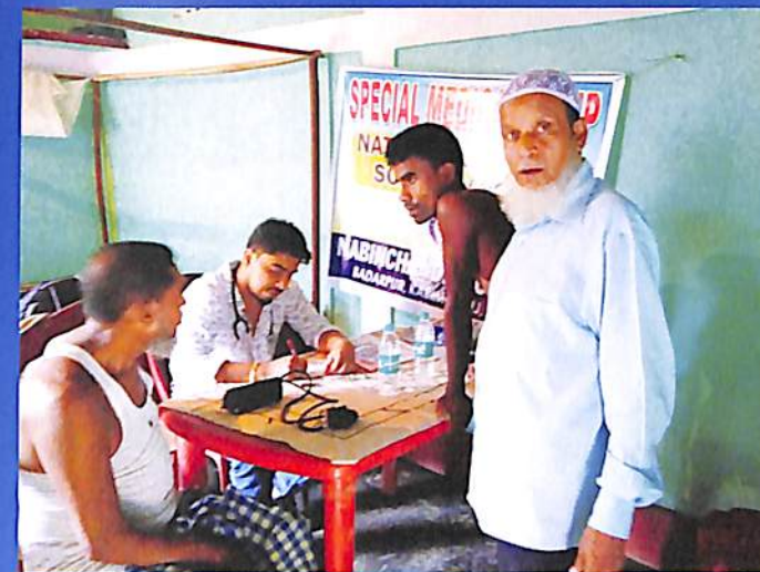
Special Medical Camp (NSS) 2018