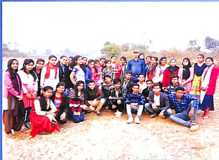
Educational Tour of Bengali Dept. 2018