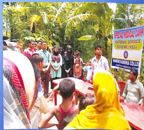
Special Medical Camp (NSS)