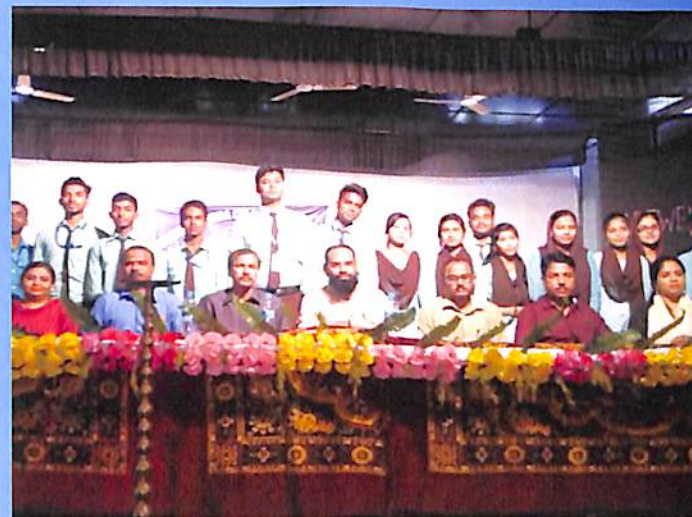
With Students' Union 2018 after Oath taking ceremony