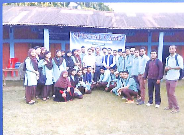
Special Camp NCC Odd Sem. 2018