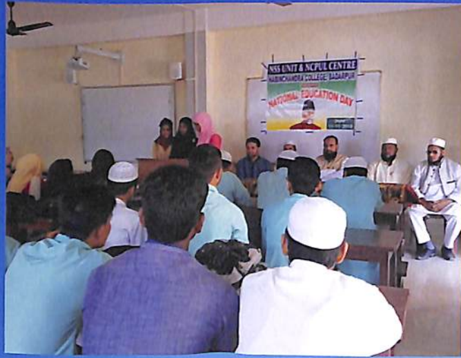
Observation of National Education Day 2018