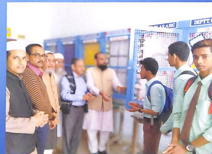
Inauguration of Wall Magazine Dept. of Arabic 2018