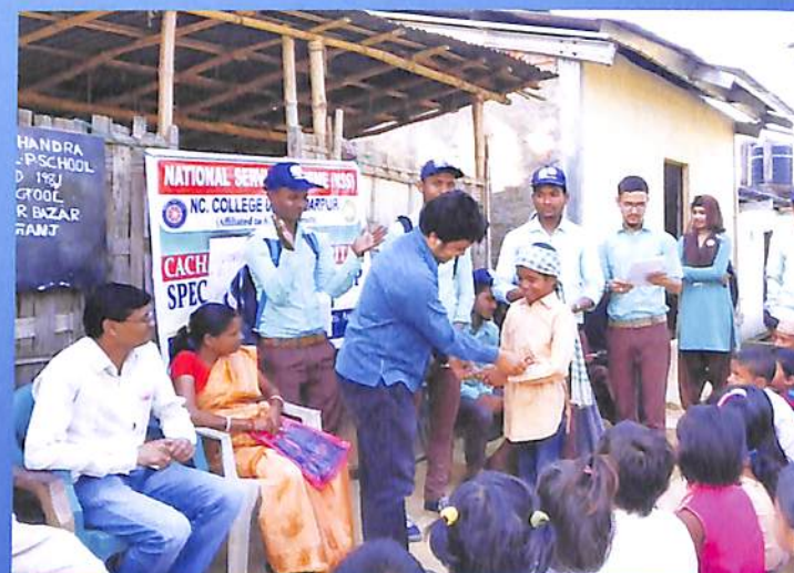
NSS Special Camp Odd Sem 2018