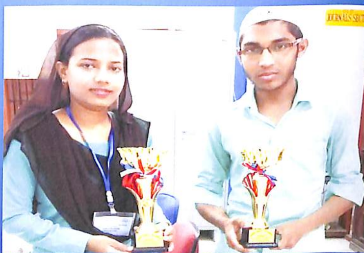
Best Library Users award 2018