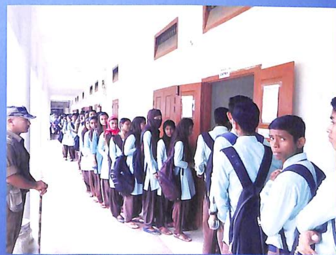
Polling of Union Election 2018-19