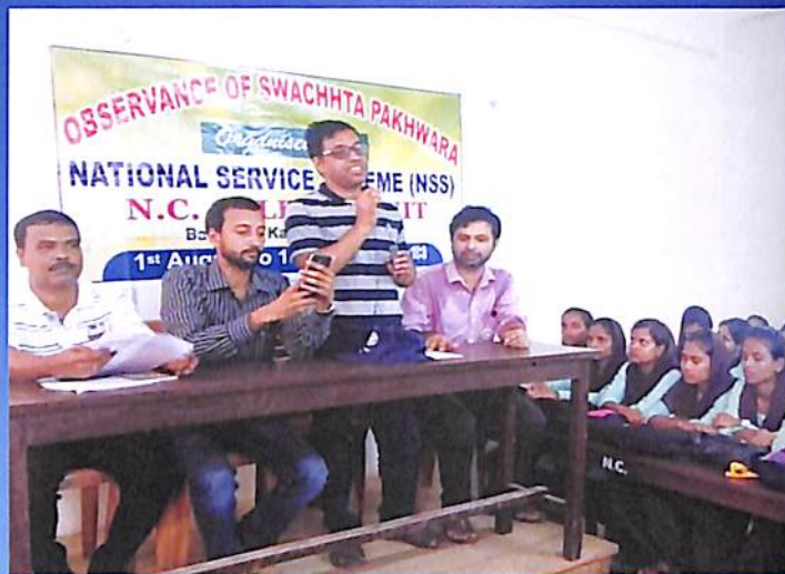
Observance of Swachhta Pakhwara 2018