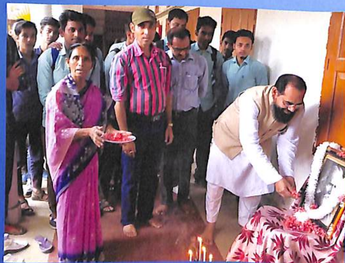
Birthday of Rabindranath Tagore's