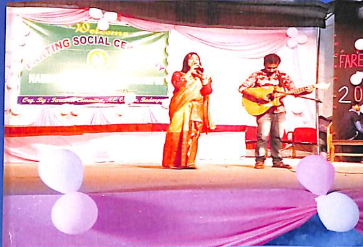
Parting Social 2018